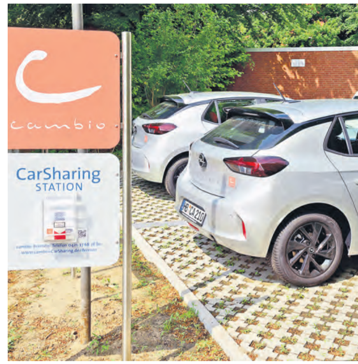
Die neue Cambio-Station an der Eislebener Straße.