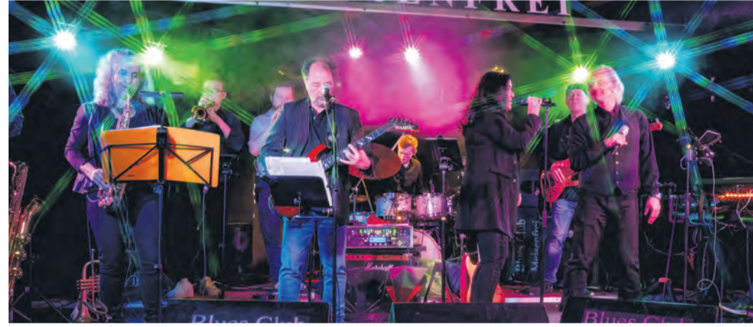
Bass, Bläser und Blues: Wer die Funk-Band Caliber 38 Reloaded einmal gehört hat, wird in Hemelingen mindestens mitwippen oder sogar tanzen.

Noch mehr Sport zum Zuschauen und Mitmachen steht beim Beachvolleyball, Kleinfeld-Fußball und Boule auf dem Plan. Gleichzeitig dürfen