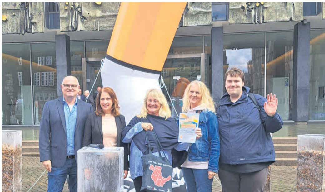
Die Kippen anderer Bremer entsorgt: Diese Hemelingerinnen und Hemelinger sind die drittbesten Sammler der Stadt.

„Mit dem Preisgeld von 1.000 Euro soll das Blockhaus des ‚Freiräume Dammi 14‘ verschönert werden, dessen Anstrich und Inneneinrichtung in die Jahre gekommen ist“, so Benke. Das Blockhaus mit Garten steht nach Anmeldung Hemelinger Bürgerin-